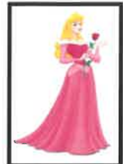
La Belle au bois dormant