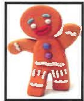
Le Bonhomme en pain d'épice