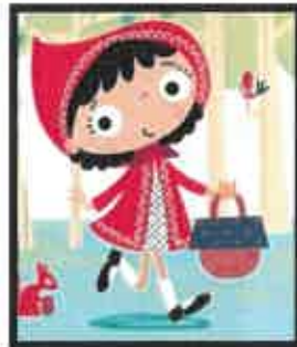
Le petit Chaperon rouge