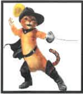
Le chat Botté