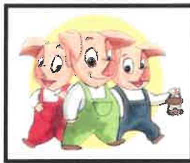
Les 3 petits cochons